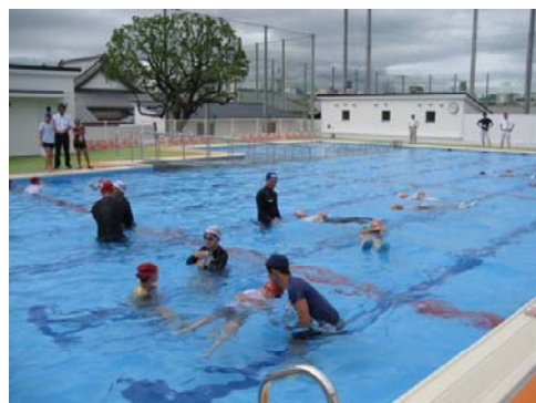
昨年度実施状況（実技）