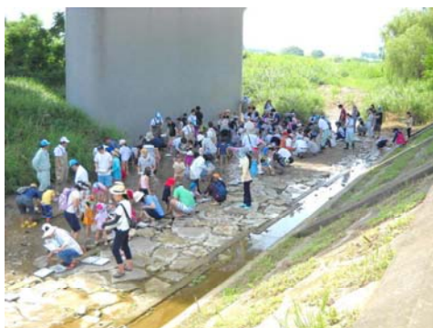
昨年度実施状況（水生生物調査）