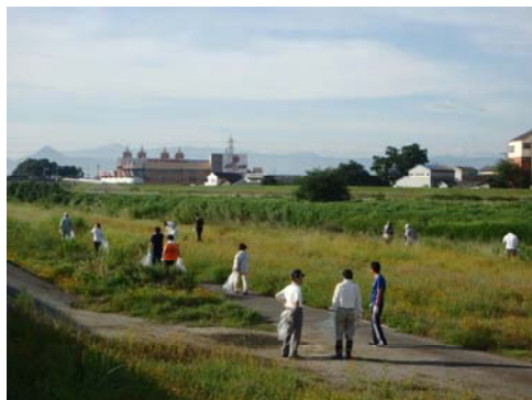
昨年度実施状況（土器公園）