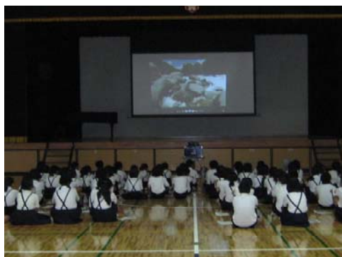
昨年度実施状況（講義）