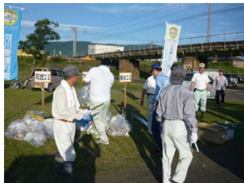
昨年度実施状況（祓川運動公園）