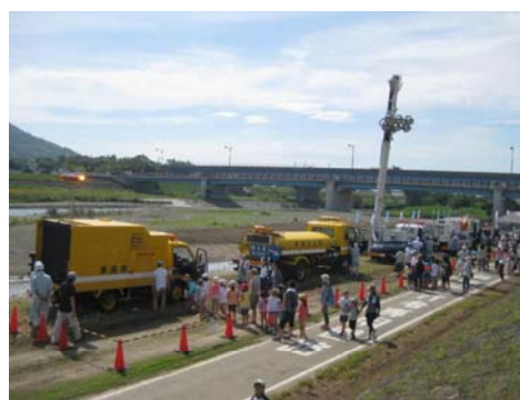
昨年度実施状況（災害対策用機械等の試乗体験）