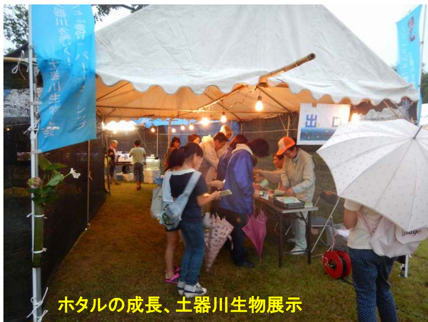
ホタルの成長、土器川生物展示