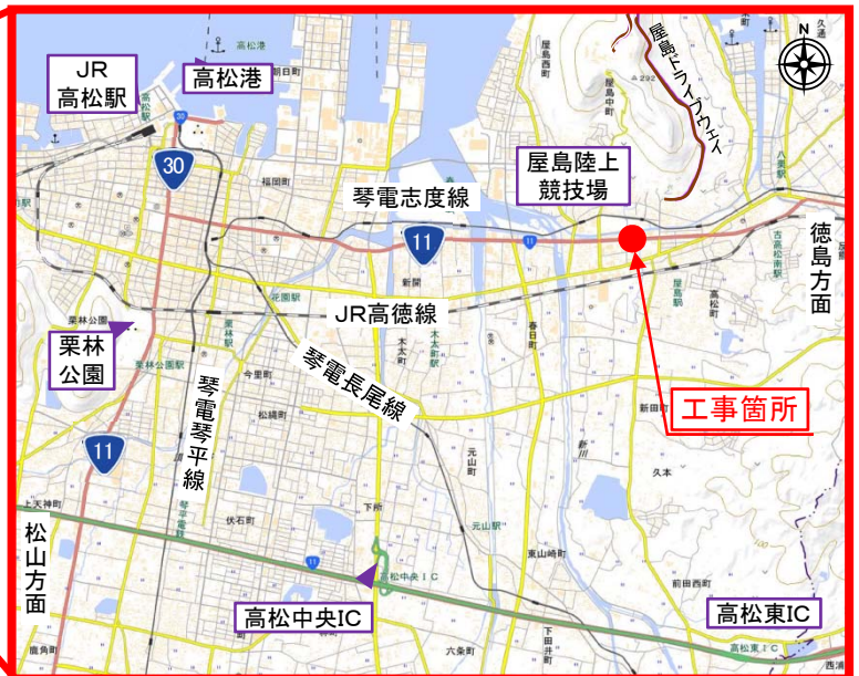
この地図は国土地理院の地理院地図に加筆したものである