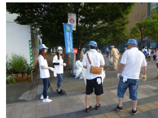
88クリーンウォーク