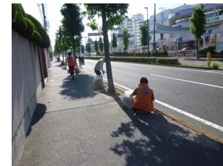
植樹帯の清掃活動