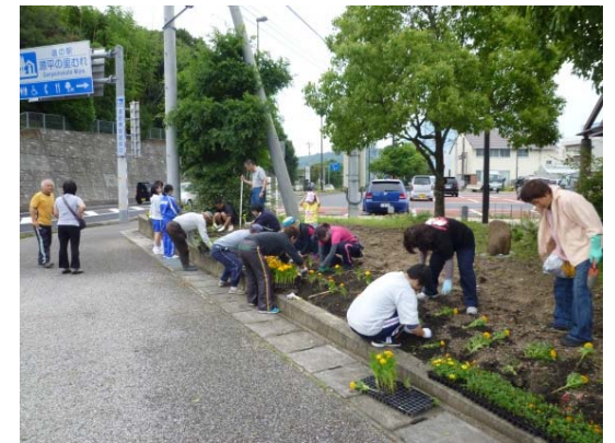
植樹帯の清掃・除草