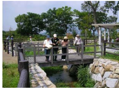
長尾地区 親水公園