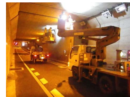
天井および壁面部点検状況