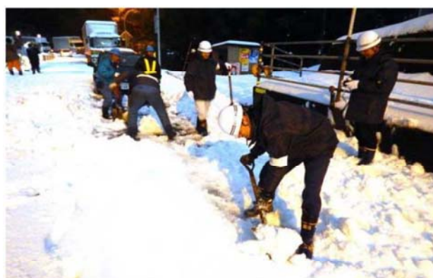
スコップ隊の除雪作業状況