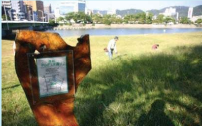
市民団体による看板設置事例（太田川）