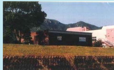
市民団体による活動拠点の整備事例（佐波川）

※ 河川管理者から河川管理施設の維持、除草等の委託を受けることも可能となります。委託先については、公募等の適正な手続きを経て選定を行う予定です。