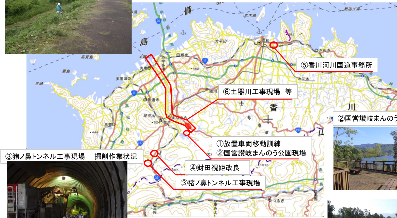
③猪ノ鼻トンネル工事現場 掘削作業状況