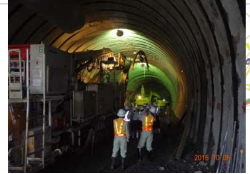
③猪ノ鼻トンネル工事現場 掘削作業状況