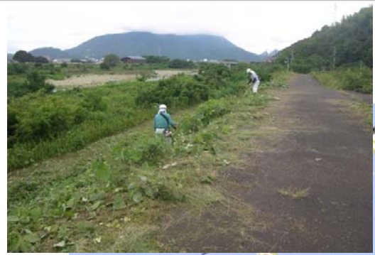
⑥土器川工事現場 除草、伐木等作業状況