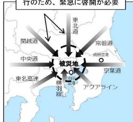
(首都直下地震における八方向作戦の例)