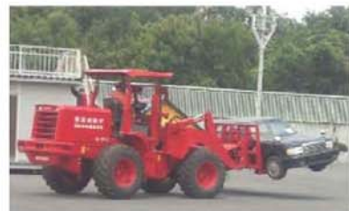
車両移動のための具体的方策 (例:ホイールローダーによる移動)