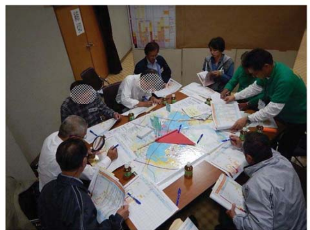
タイムライン(自助)の検討