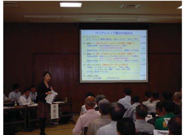
ファシリテータによる進行