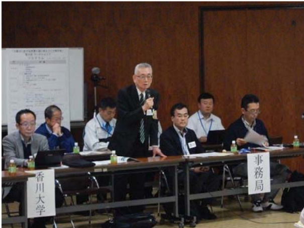
「検討会」会長の挨拶

◆開催日時 : 平成27年11月7日(土) 14:00~16:30 ◆開催場所 : 丸亀市民会館 中ホール