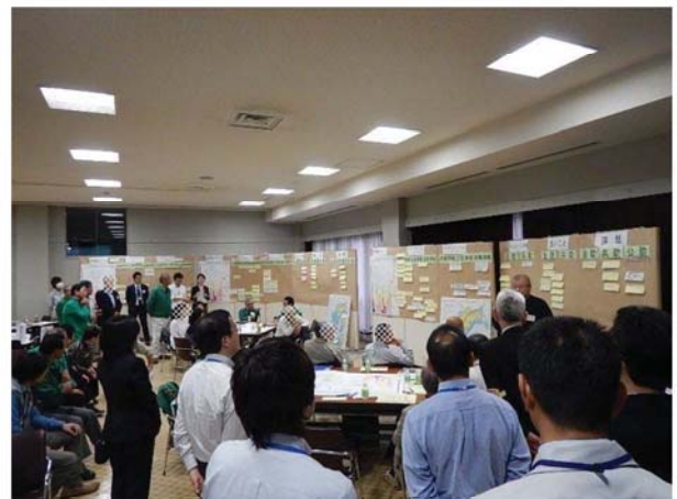
テーブル発表(代表テーブル)