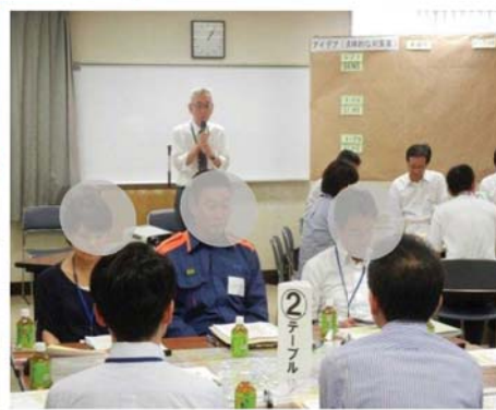
「第1回検討部会」開催状況 （H26.10.1）