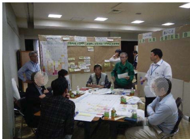
タイムライン(共助)の検討