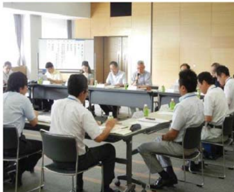
「第1回検討会」開催状況（H26.8.7）