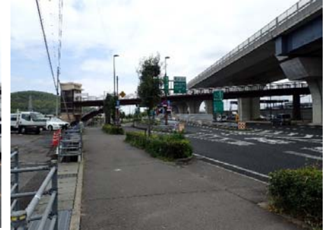
④ 勅使西横断歩道橋昇降設備(3基)