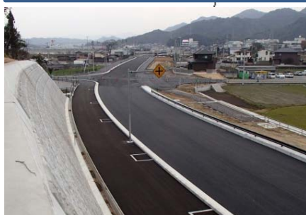
写真 東かがわ市白鳥付近 (平成27年3月3日現在)