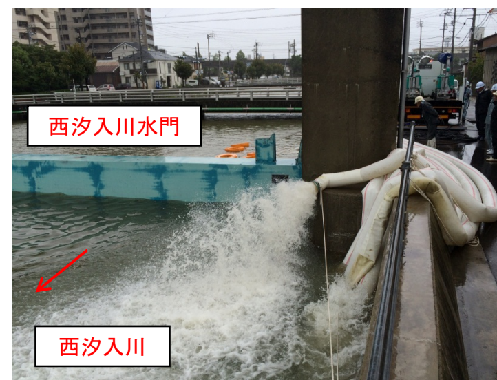
高潮被害防止のため西汐入川水門を閉塞し西汐入川の河川水を海側に排水中