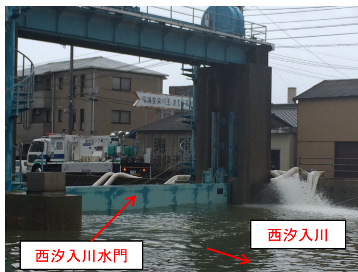
ポンプ車稼働全景