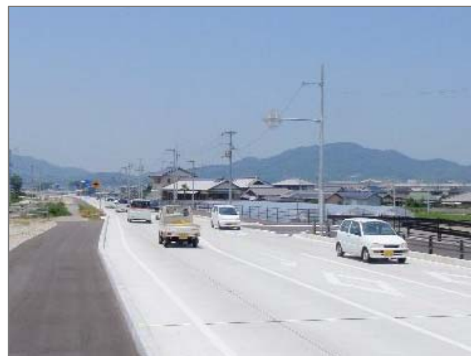
< 3箇月後の状況 > バイパスの通行状況 (写真③)