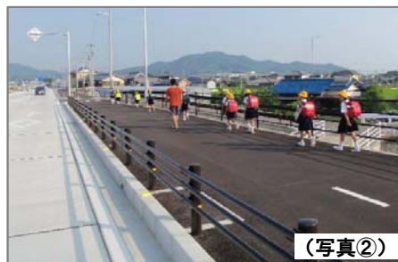
< 3箇月後の状況 > バイパスの歩道を 通学する小学生