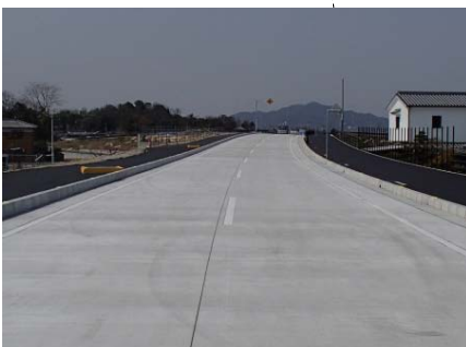
写真① 東かがわ市川東付近 (平成26年3月19日現在)