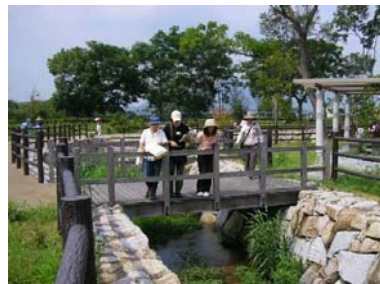
長尾地区 親水公園