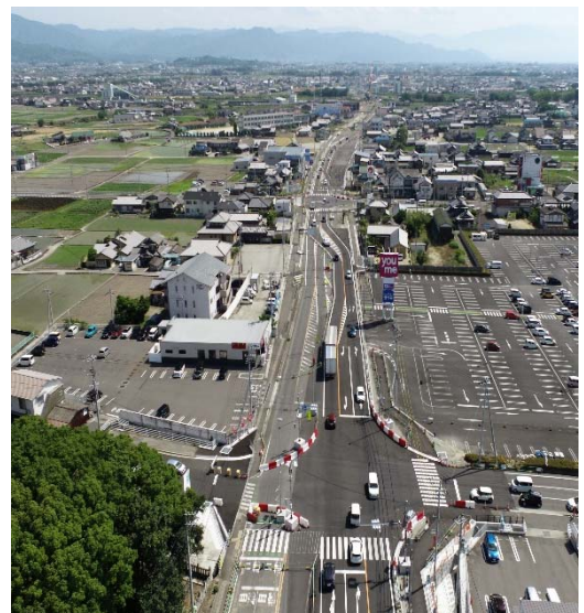
本山甲地区の全景です。