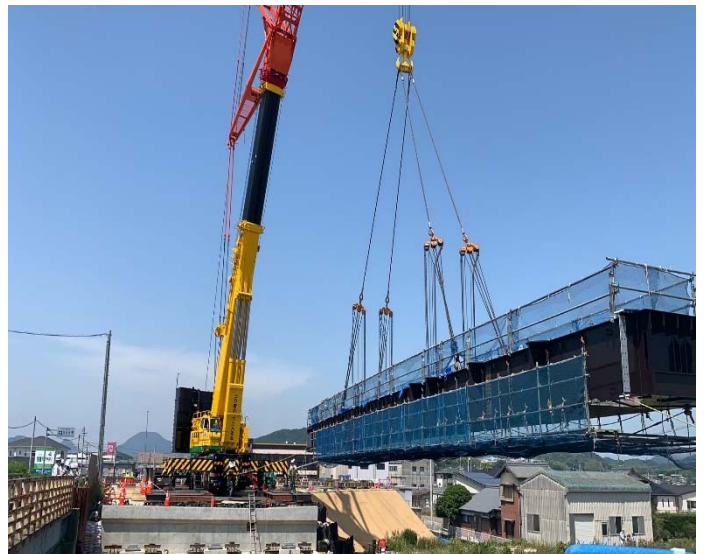
本山小橋上部を施工しています。