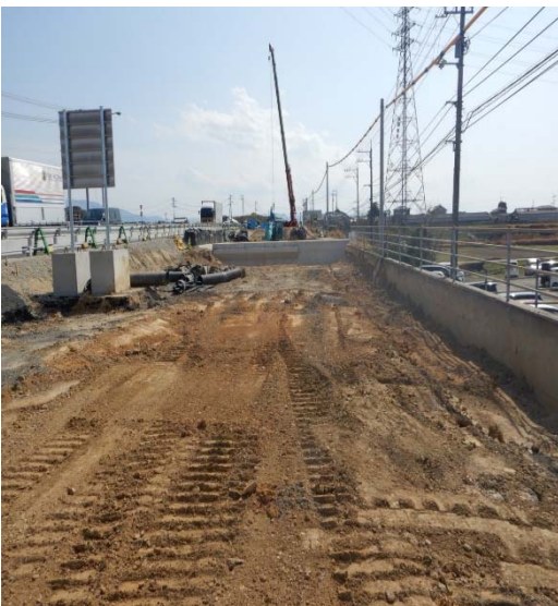
上高野地区の改良工事を行っています。