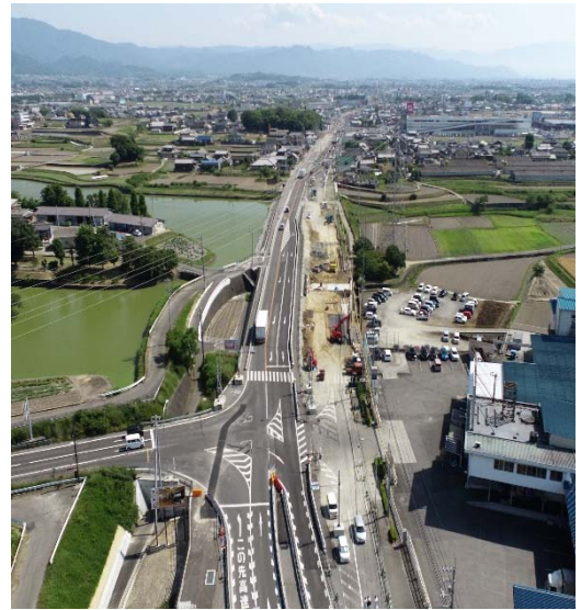
令和4年6月撮影（車線切替中）