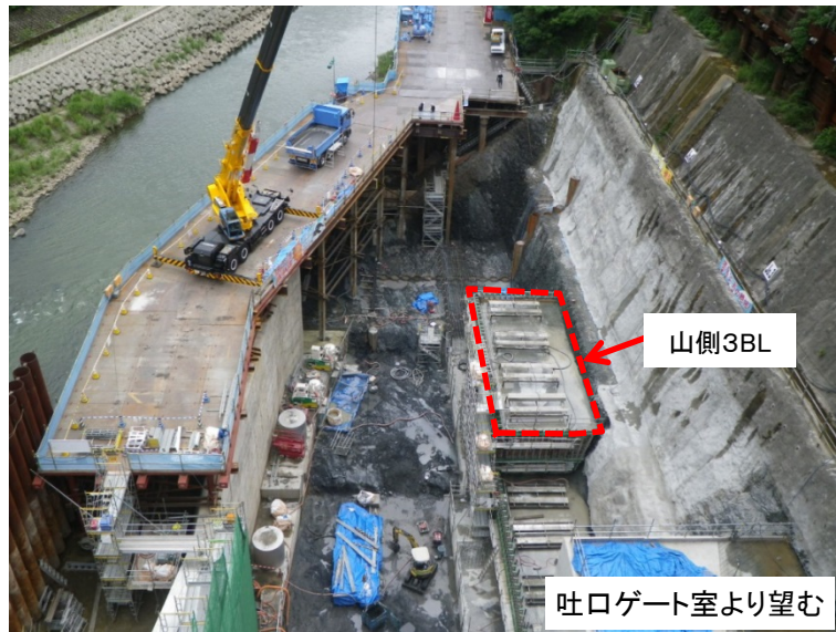
7月2日 山側3BLレイタンス処理