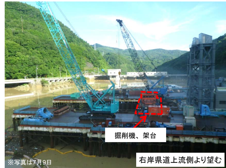
7月17日 掘削機架台移動