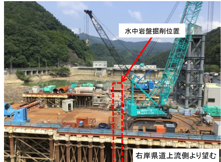
7月30日 掘削機による流入水路掘削