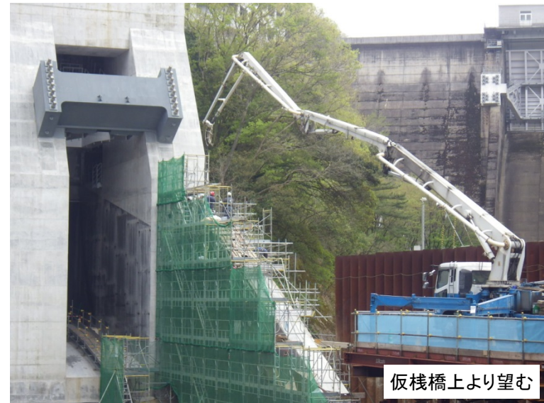
4月9日 川側1BLコンクリート打設