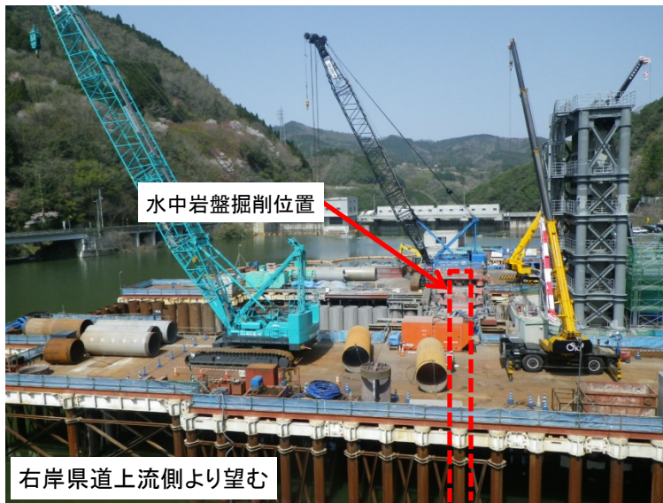
4月2日 掘削機による水中岩盤掘削