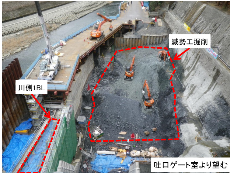
3月5日 掘削および川側1BLコンクリート養生