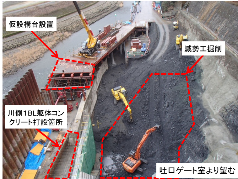
2月5日 掘削、仮設構台設置および型枠組立