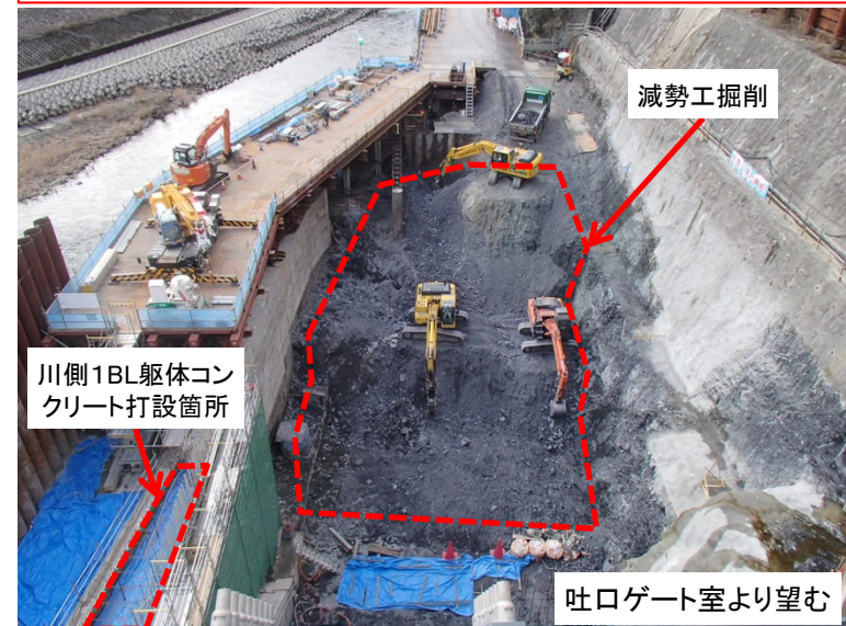
2月26日 掘削およびコンクリート養生