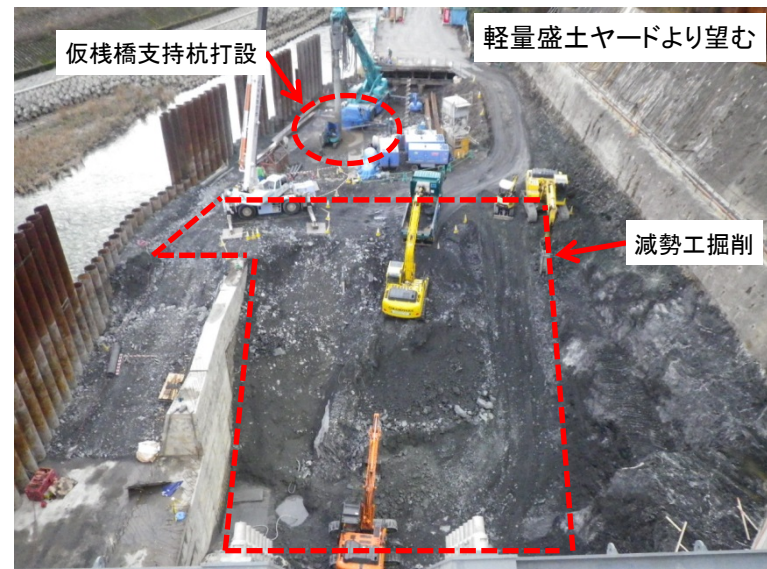
12月11日 減勢工掘削および仮棧橋支持杭打設