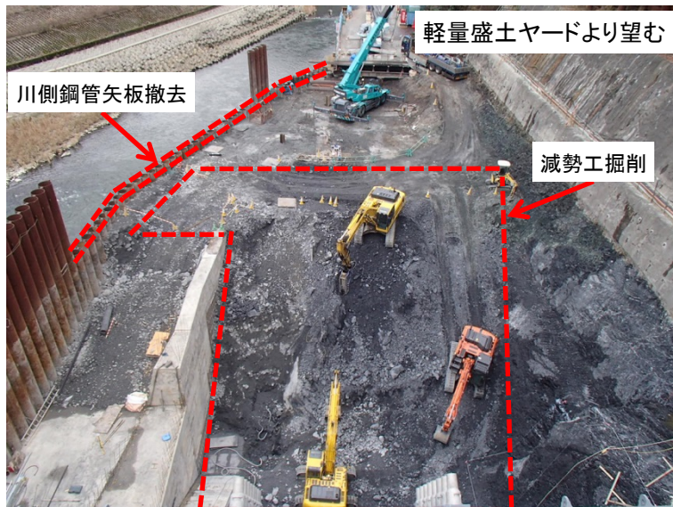
12月18日 減勢工掘削および川側鋼管矢板撤去