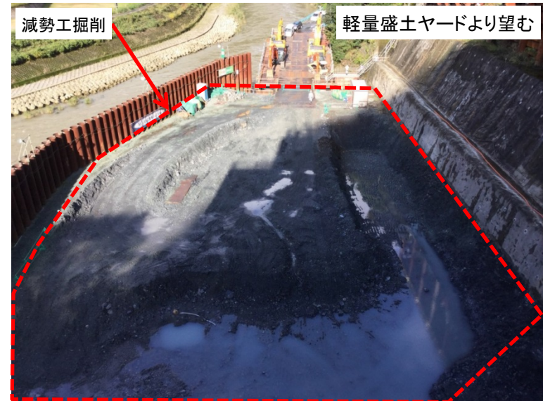
10月23日 減勢工掘削作業