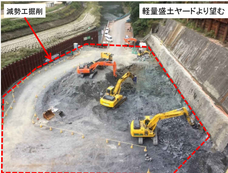
10月16日 減勢工掘削作業開始