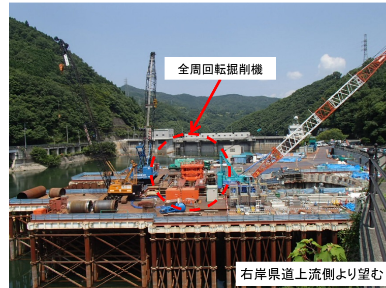
7月24日 全周回転掘削機組立・据付完了