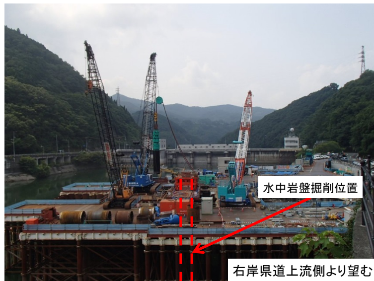
7月31日 掘削機による水中岩盤掘削作業開始