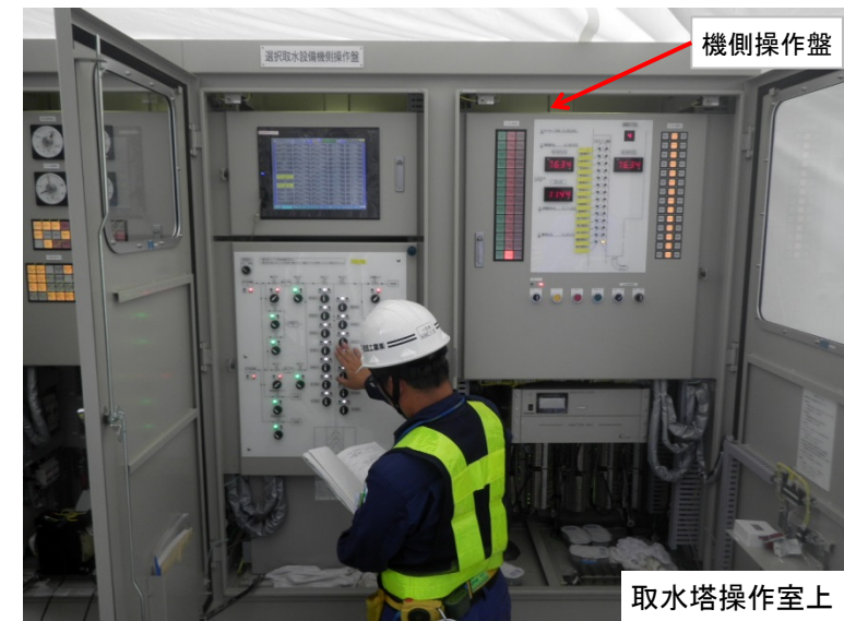
9月26日 試運転・調整工