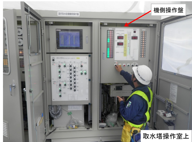
9月19日 試運転・調整工