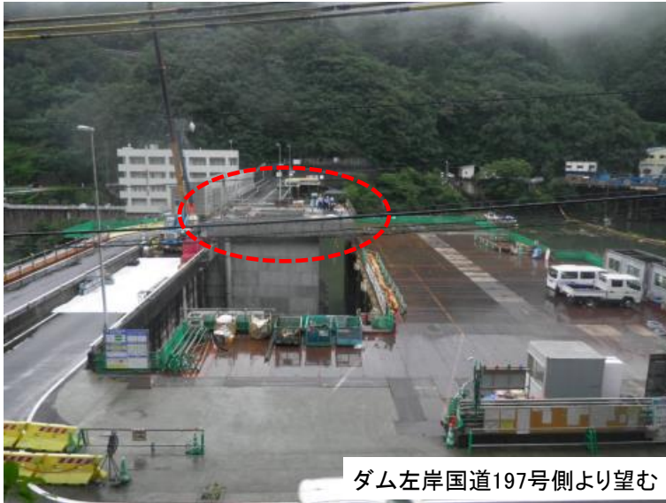
7月11日 空気制御設備据付