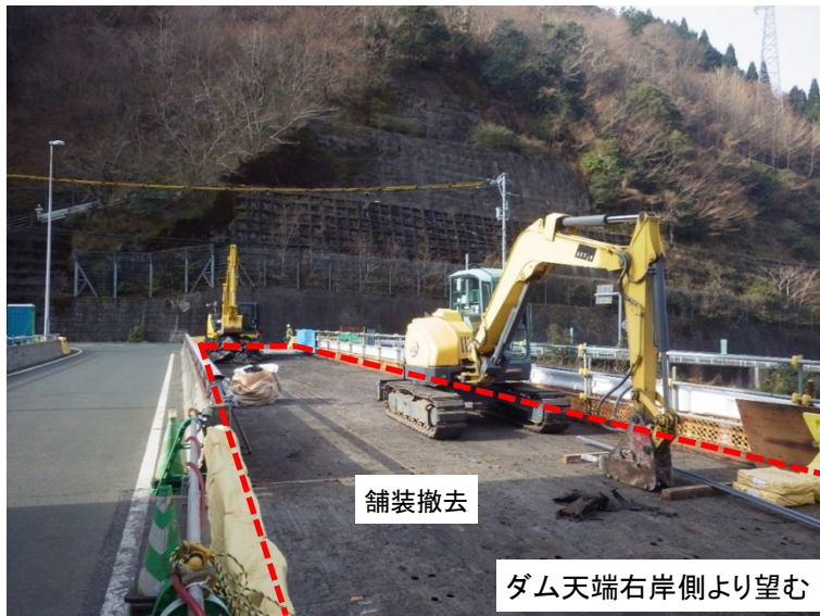
1月10日 下流仮設構台を撤去するための舗装撤去