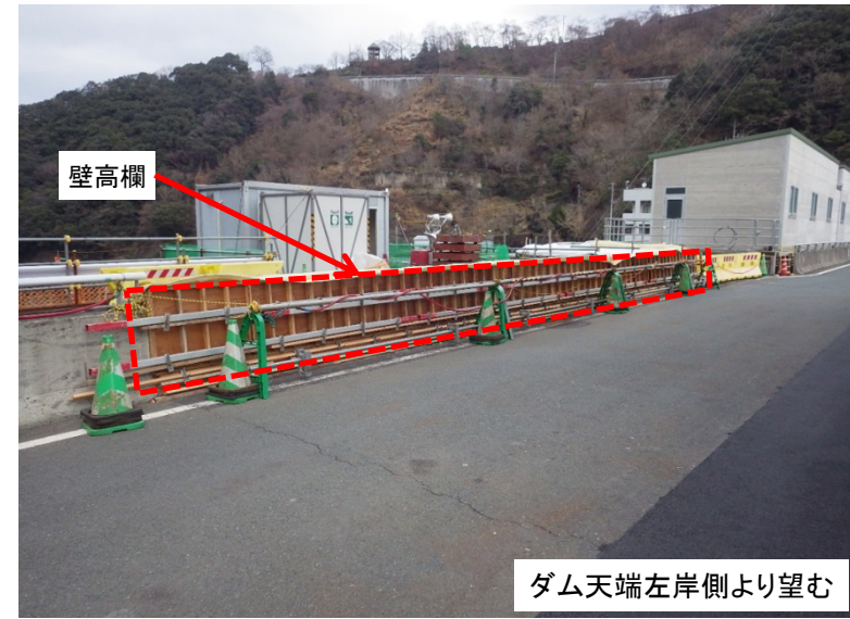
1月17日 一部撤去していた壁高欄の復旧