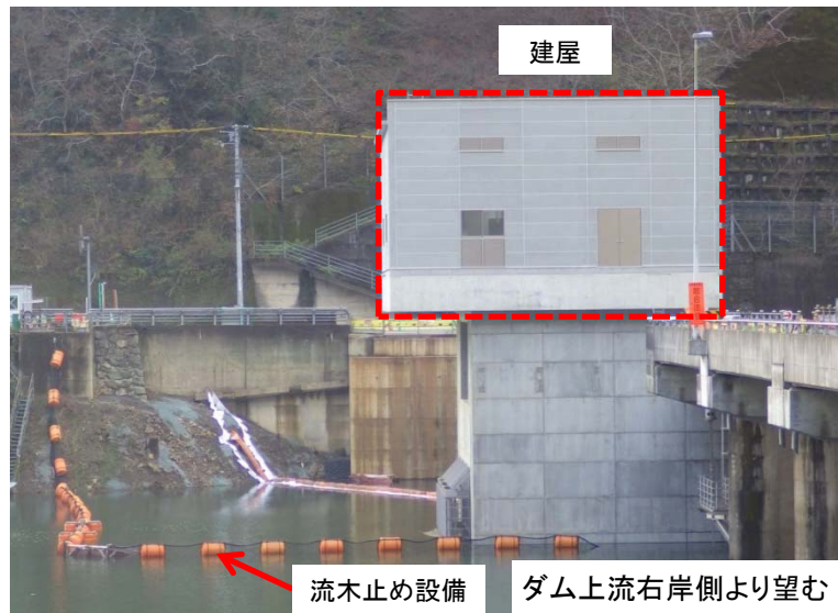
12月19日 流木止め設備の設置、構台撤去(100%)