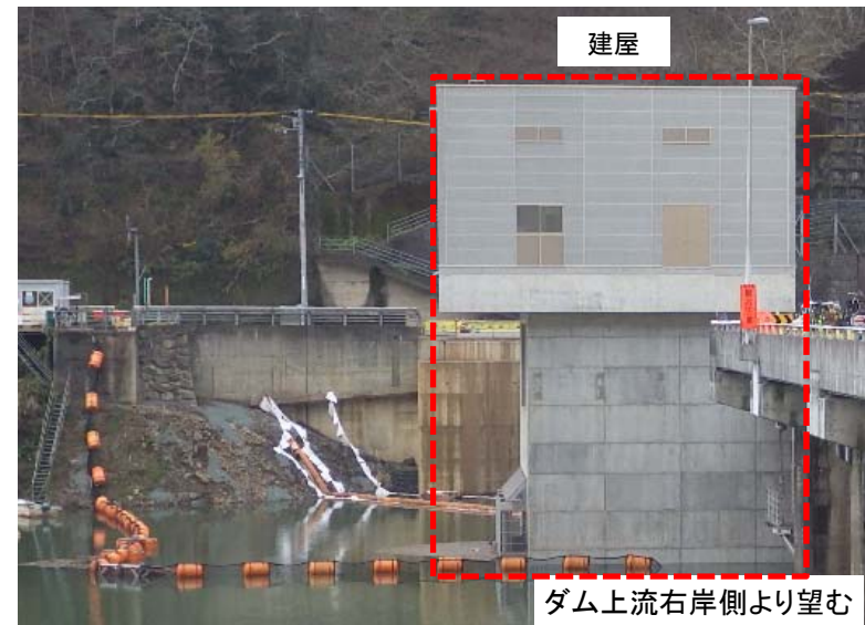
12月26日 選択取水設備完成