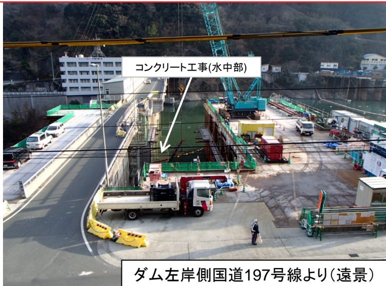
1月5日 新設取水塔接合部分処理(はつり)