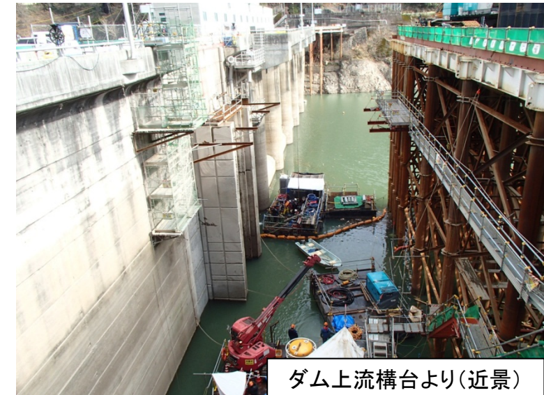
1月26日 新設取水塔接合部分処理(はつり)