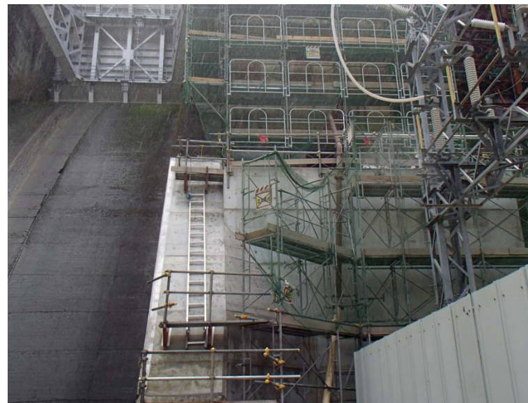
9月16日 低水放流バルブ室構築