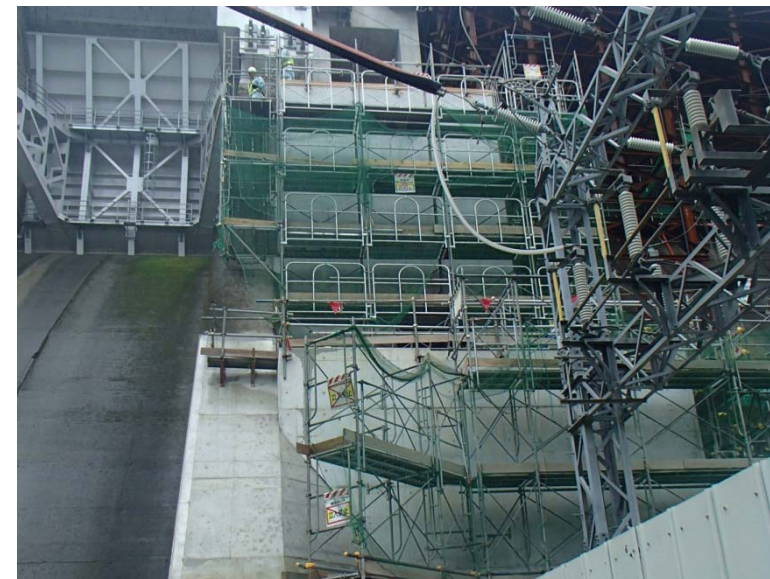
9月22日 低水放流バルブ室構築