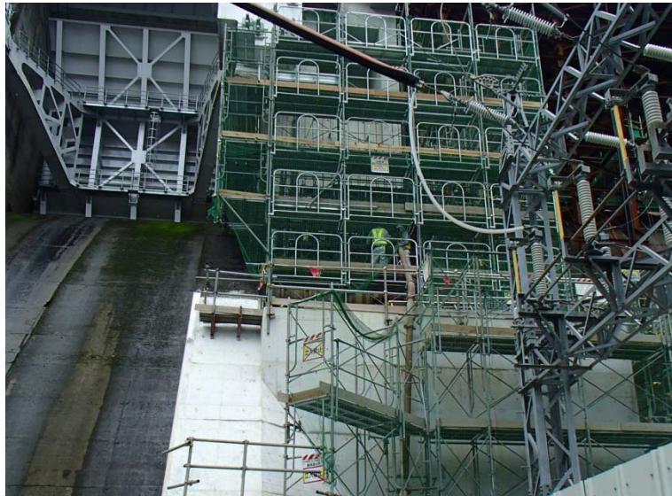
9月1日 低水放流バルブ室構築