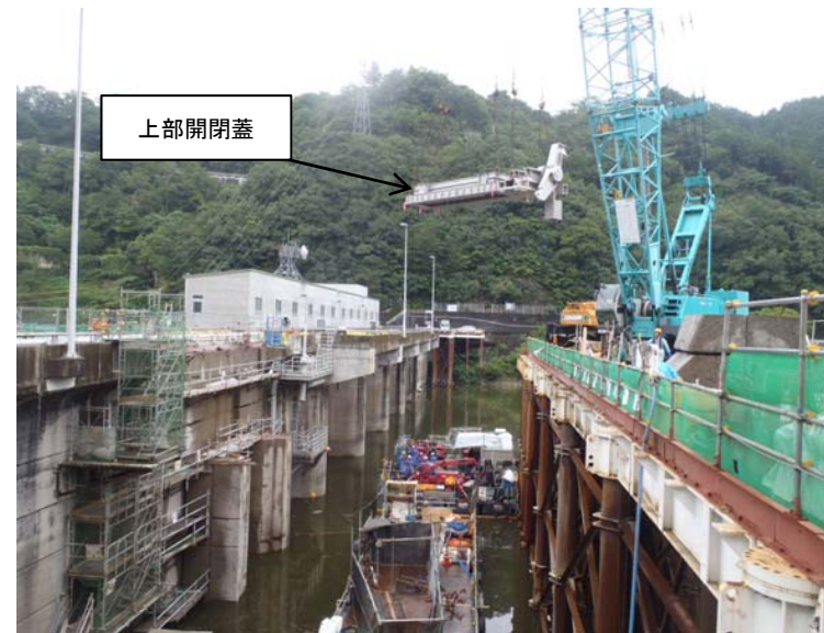
8月25日 チャンバー上部開閉蓋吊り込み