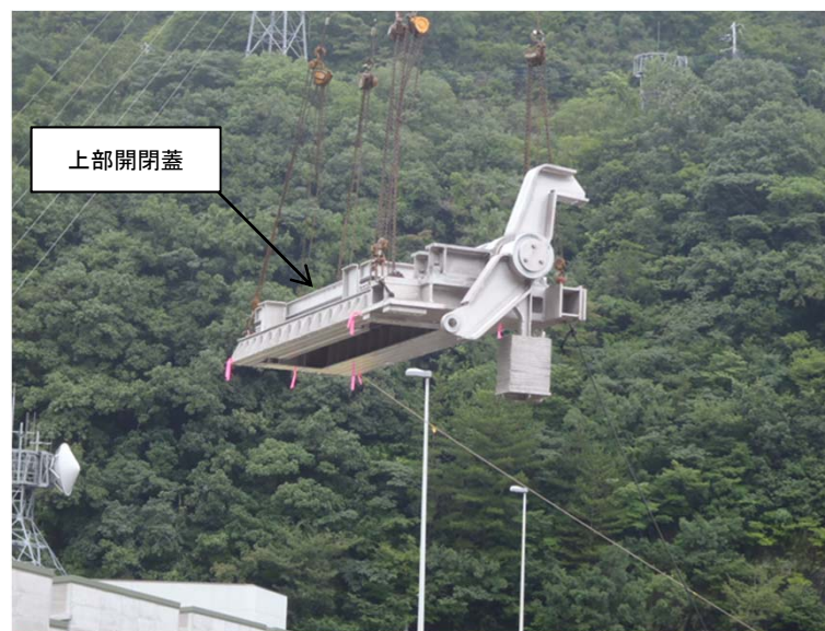
8月25日 チャンバー上部開閉蓋吊り込み