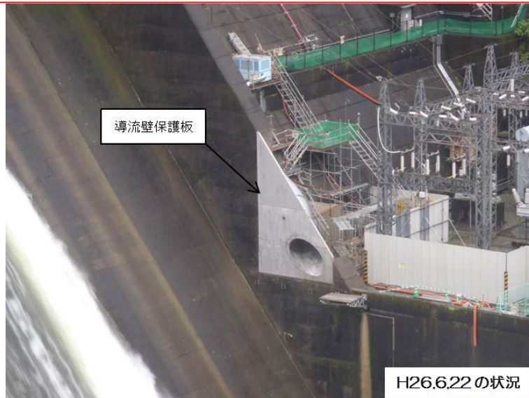
6月22日 導流壁保護板、放流管据完了