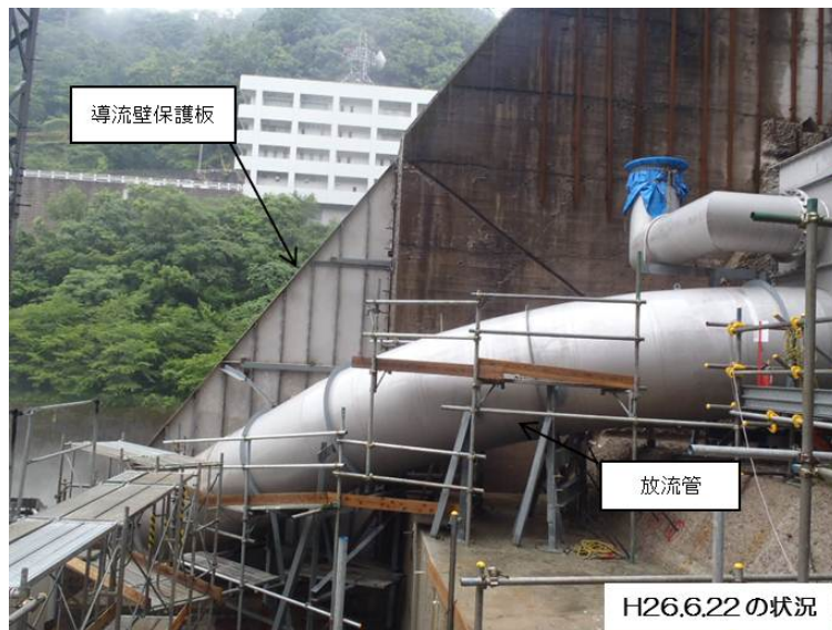
6月22日 導流壁保護板、放流管据完了