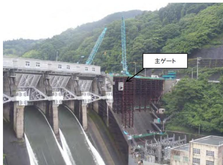
6月9日 放流管据付、主ゲート据付作業