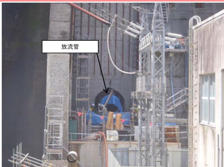
6月2日 放流管据付作業