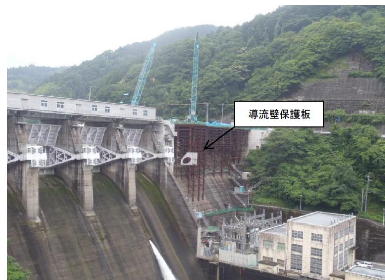
6月16日 導流壁保護板据付