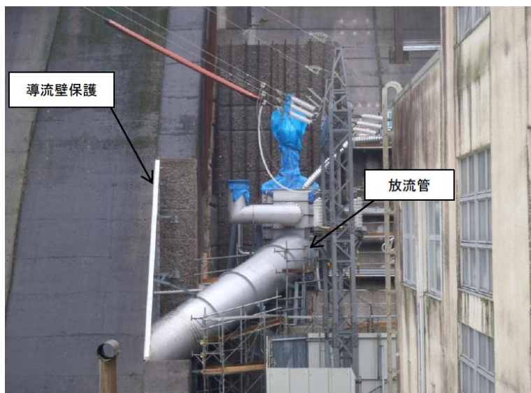
6月30日 導流壁保護板、放流管据完了