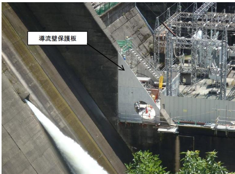
6月16日 導流壁保護板据付完了