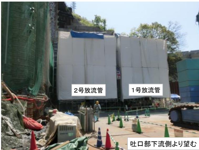
4月18日 2号放流管溶接完了