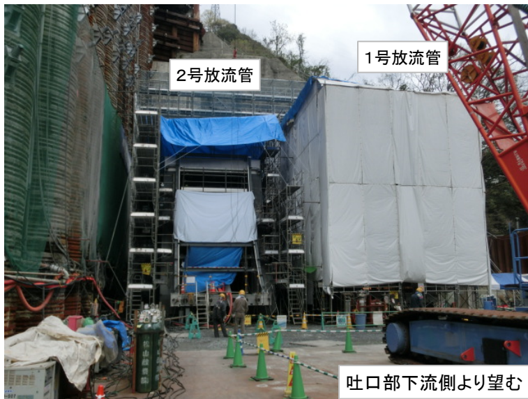
4月4日 2号放流管溶接