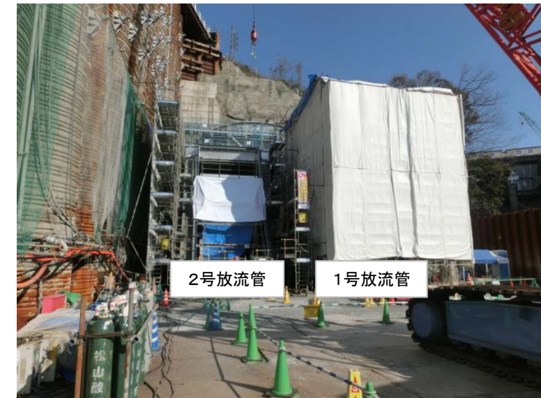
3月28日 1号放流管溶接