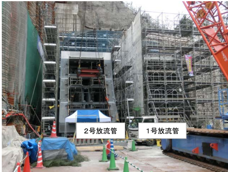
3月7日 2号主ゲート放流管組立