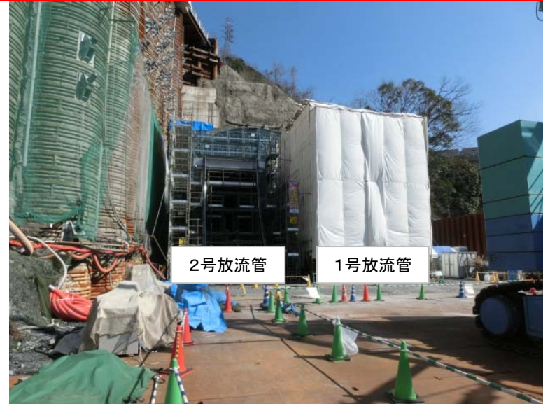
3月14日 1号放流管溶接