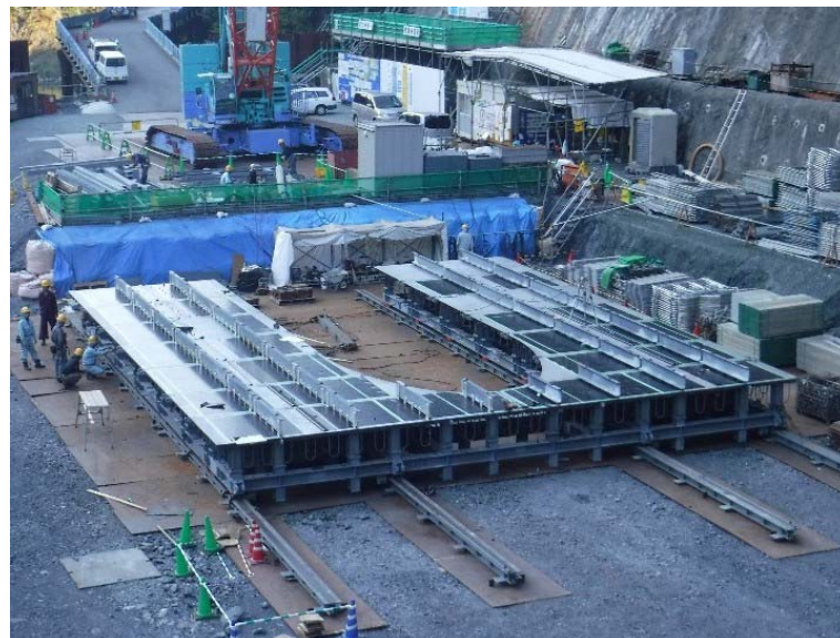
10月19日 分岐管組立準備