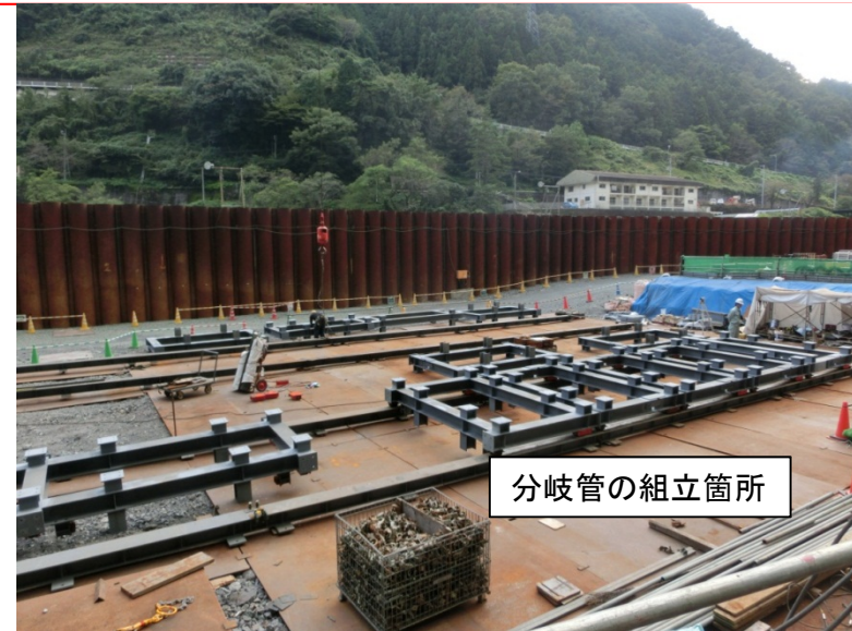
10月12日 分岐管組立準備