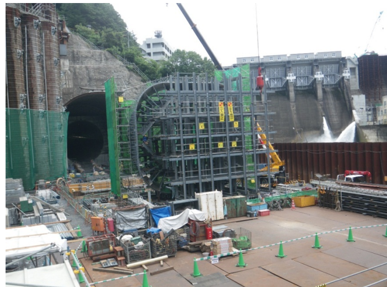
8月10日 トランジション管組立