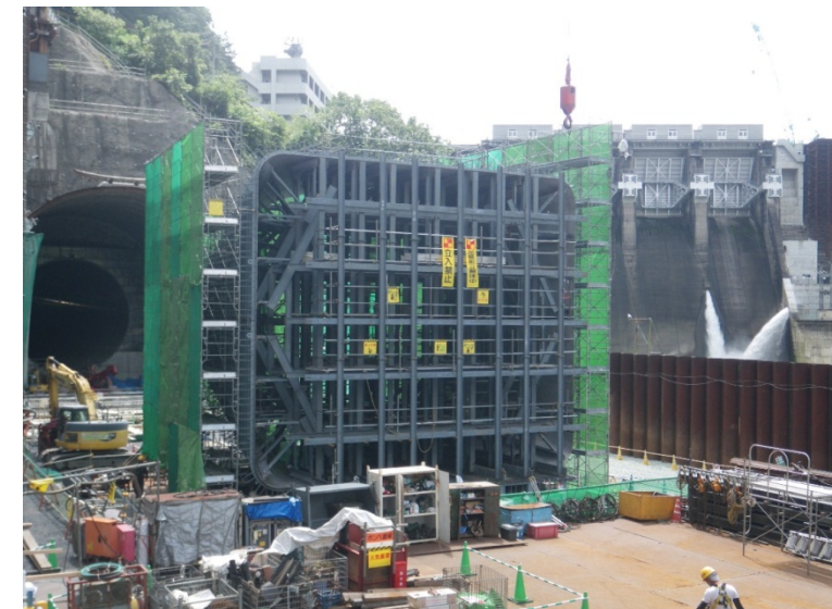
8月24日 トランジション管組立