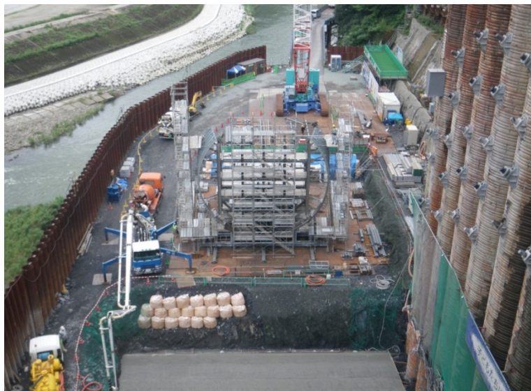
8月3日 トランジション管組立