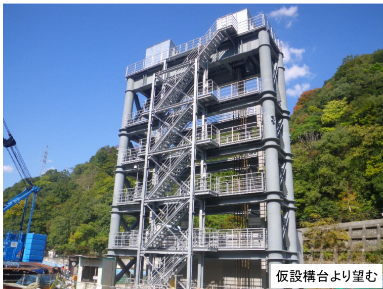
仮設構台より望む