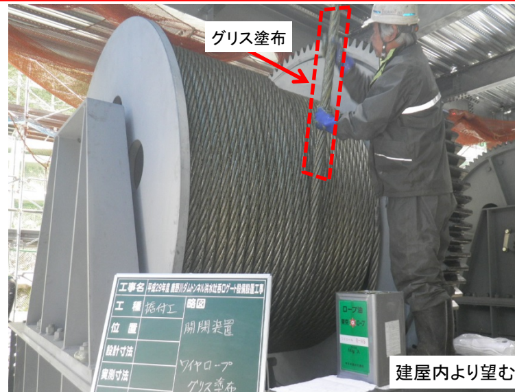
4月9日 開閉装置ワイヤロープグリス塗布