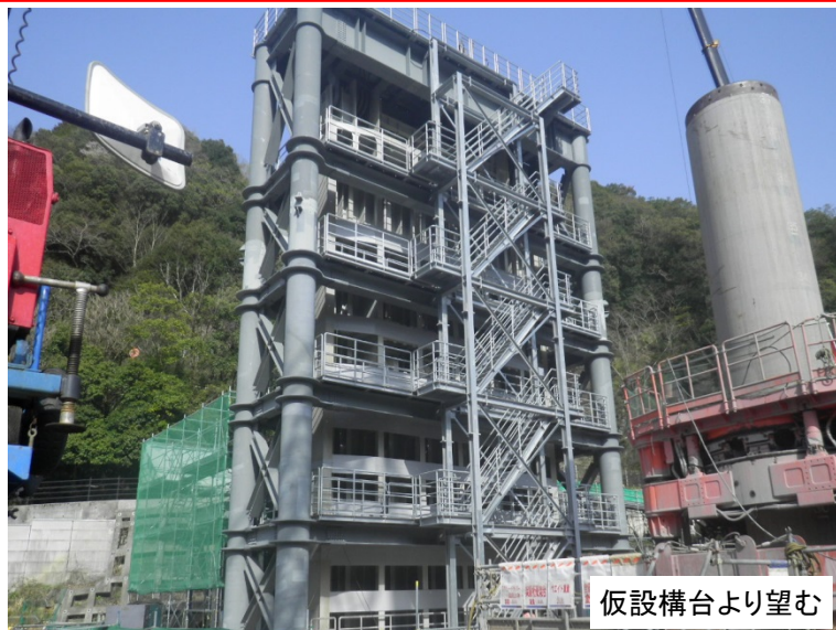
4月2日 門構外足場撤去完了