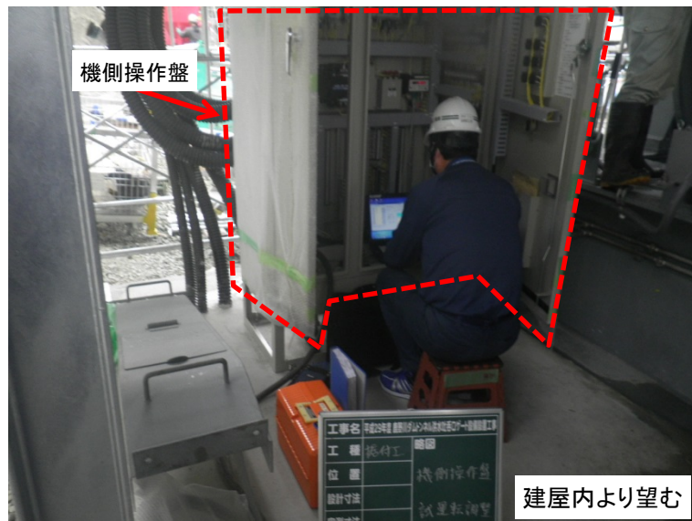
4月16日 総合試運転調整