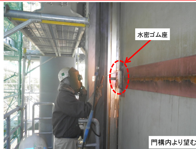
3月12日 水密ゴム座取付溶接