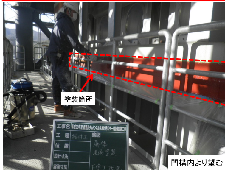
3月19日 扉体(ブロック間)塗装