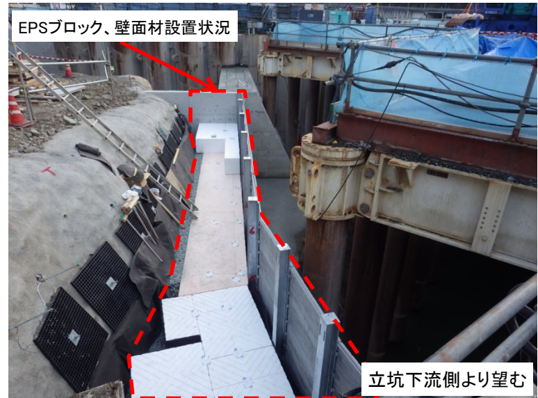
1月30日 EPSブロック、壁面材設置状況