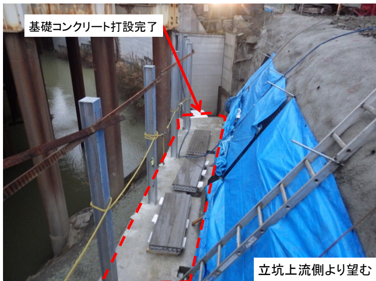
1月23日 基礎コンクリート打設完了