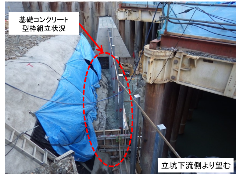
1月16日 基礎コンクリート型枠組立状況