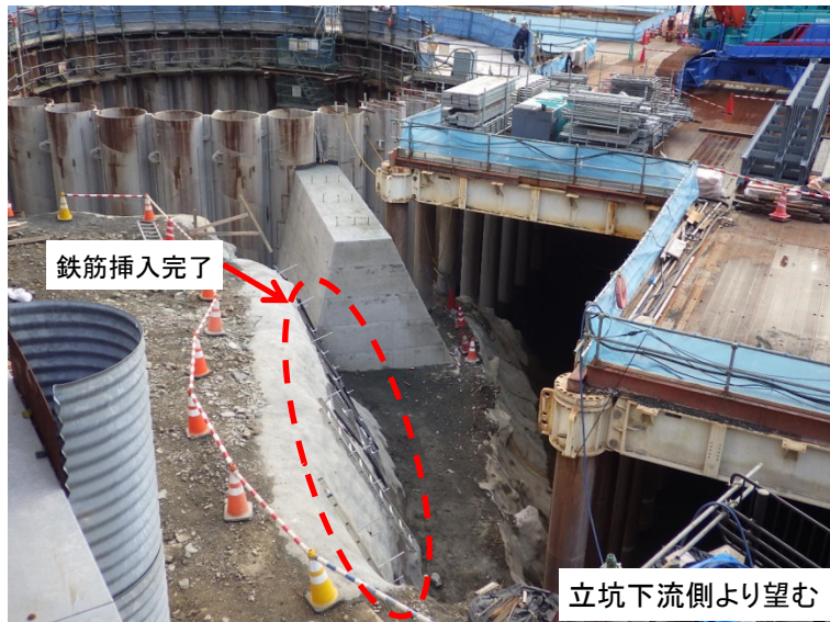
12月19日 鉄筋挿入完了