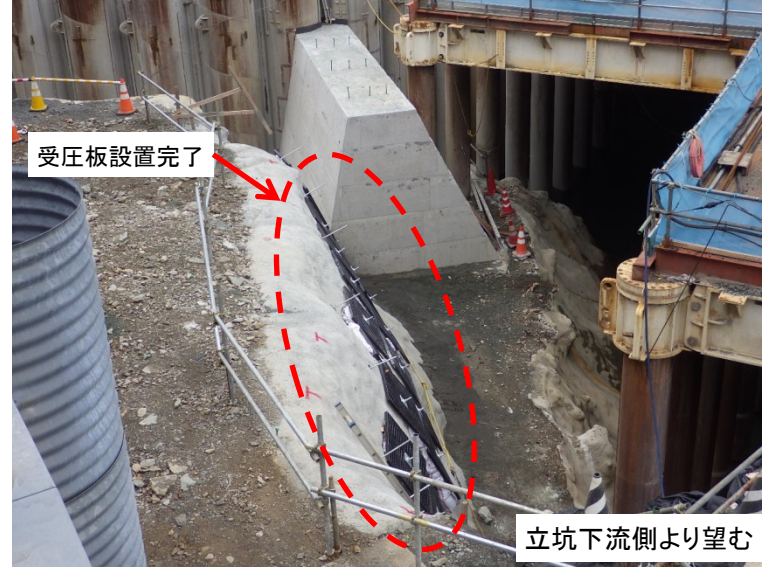
12月26日 受圧板設置完了