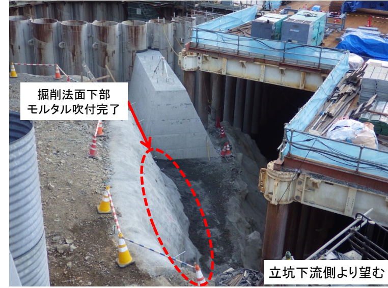
12月12日 掘削法面下部モルタル吹付完了