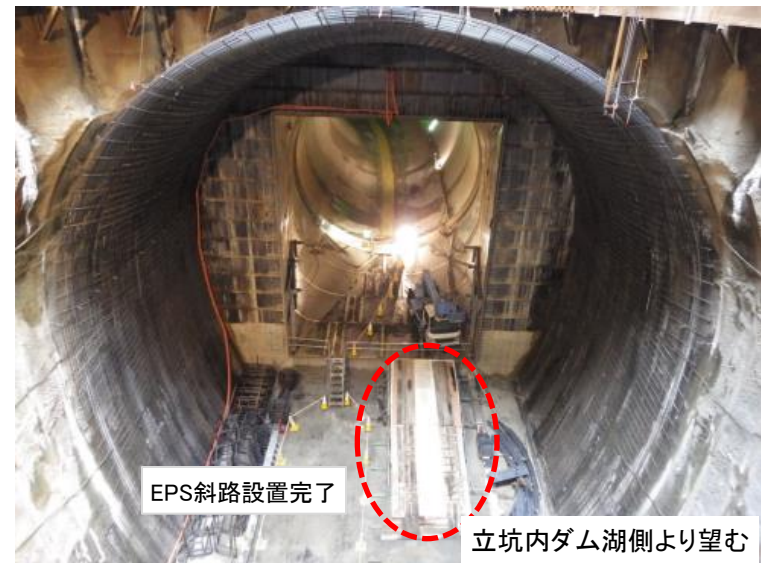
8月29日 EPS斜路設置完了