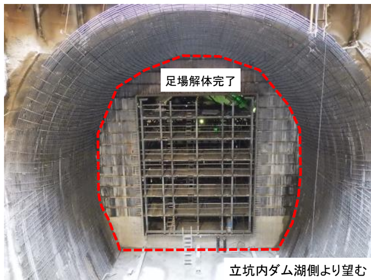
8月15日 足場解体完了