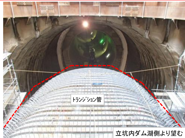
5月16日 トランジション管内周鉄筋組立