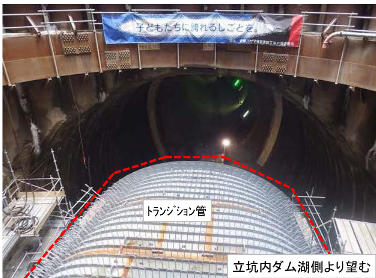
5月9日 トランジション管設置