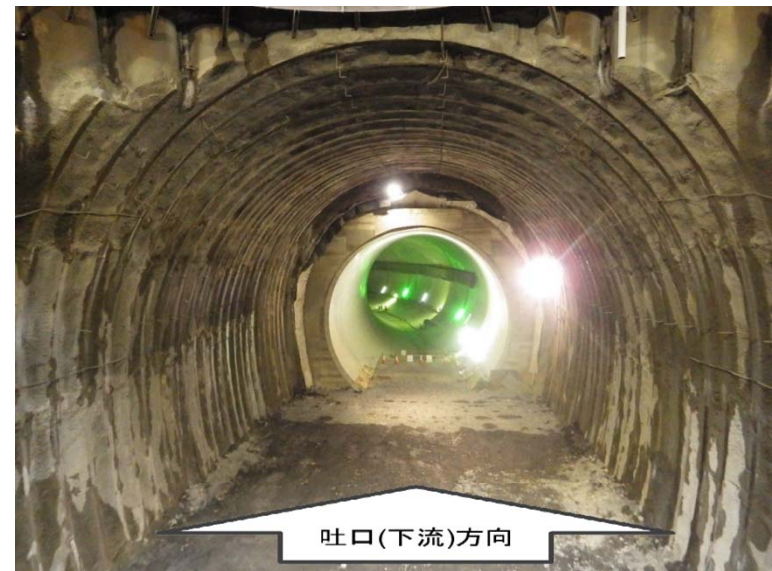
2月8日 立坑内迎え掘り掘削