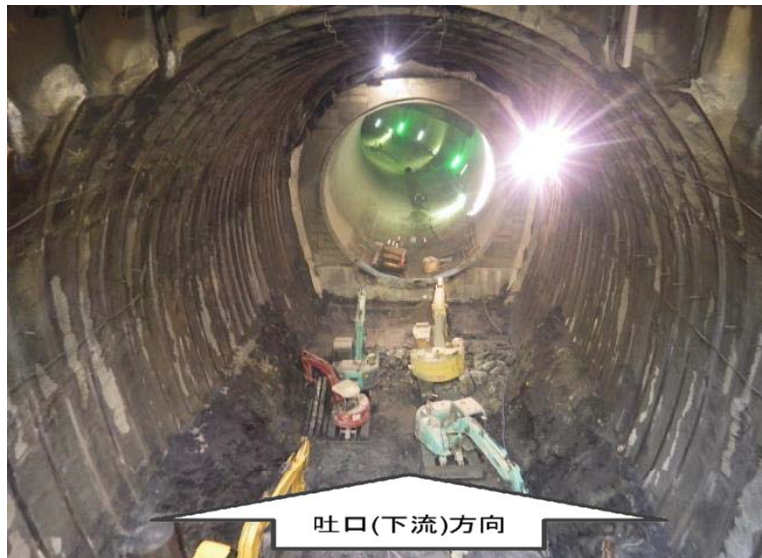
2月15日 立坑内迎え掘り掘削