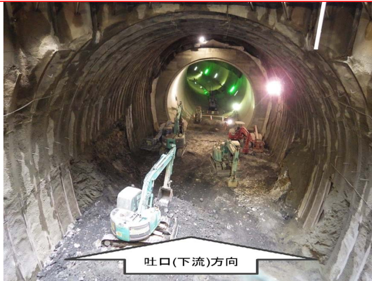
2月1日 立坑内迎え掘り掘削