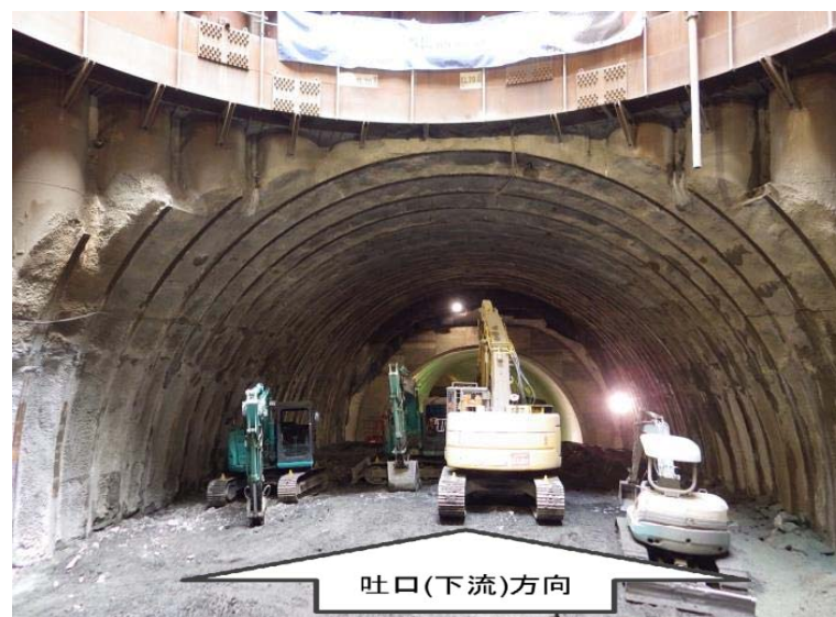
1月11日 立坑内迎え掘り掘削