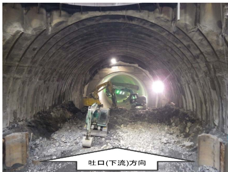
1月18日 立坑内迎え掘り掘削