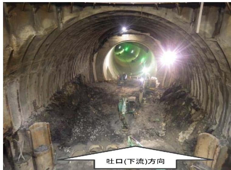
1月25日 立坑内迎え掘り掘削