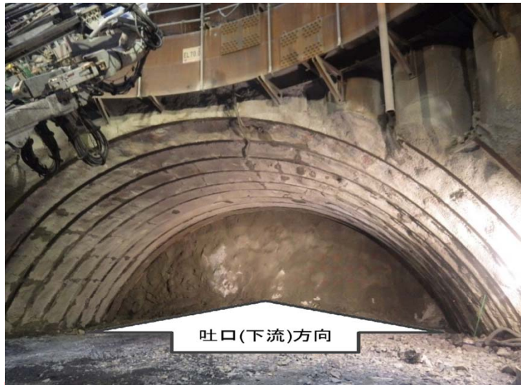
12月7日 立坑内迎え掘り掘削