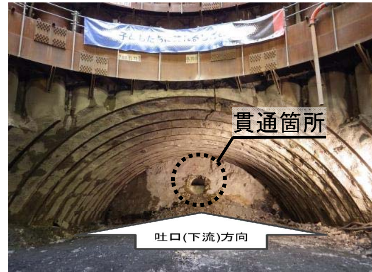
12月14日 立坑内迎え掘り掘削