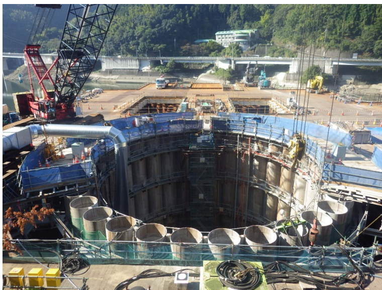
10月19日 鋼管矢板切断