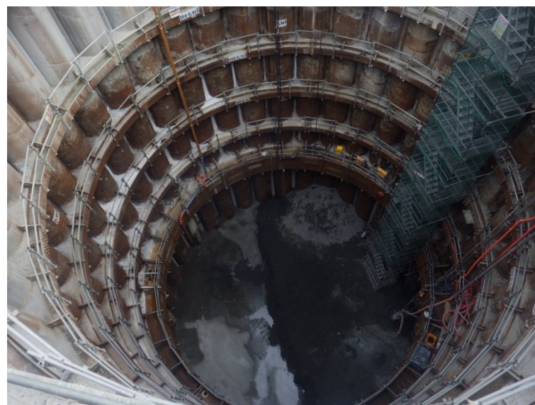
10月12日 立坑内足場埋め戻し完了