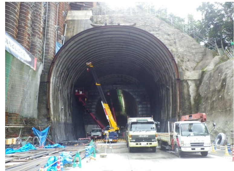
9月28日 トランジション管外周鉄筋組立