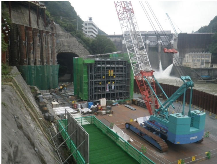
9月7日 トランジション管分岐管部の均しコン打設

9月 トランジション管分岐管部の均しコン打設、覆工・放流管接続部アーチ型枠組立、トランジション管外周鉄筋組立