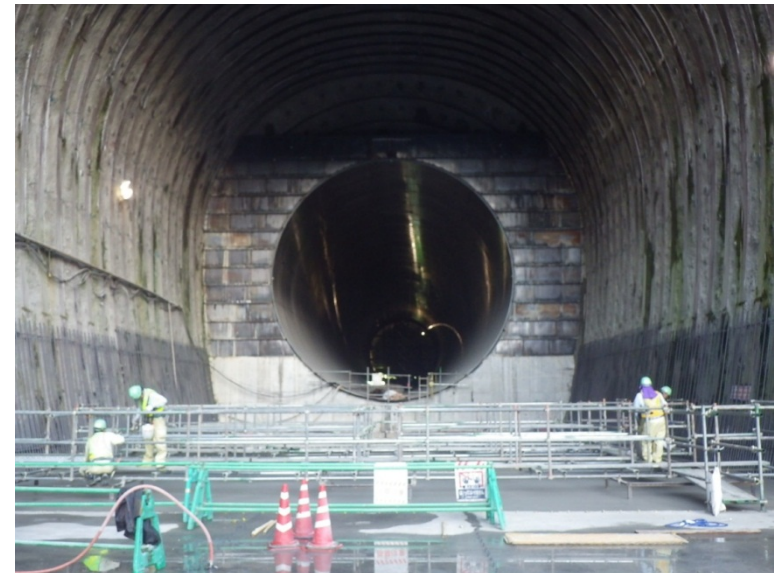
9月14日 覆工・放流管接続部アーチ型枠組立