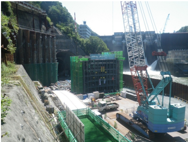
9月21日 トランジション管外周鉄筋組立