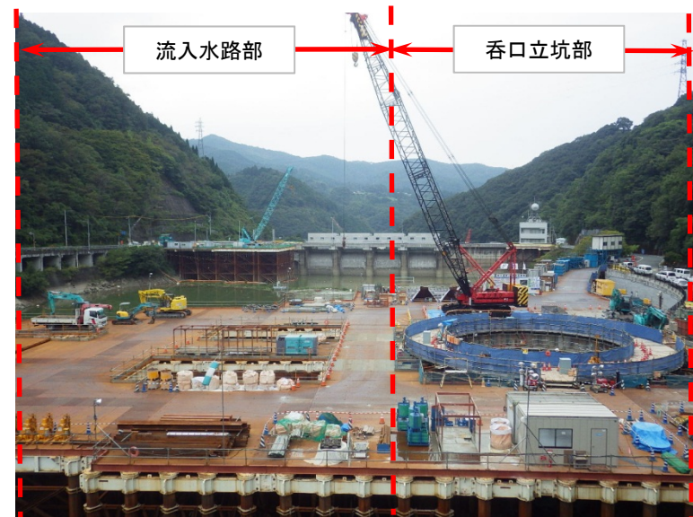
9月28日 底盤コンクリート養生